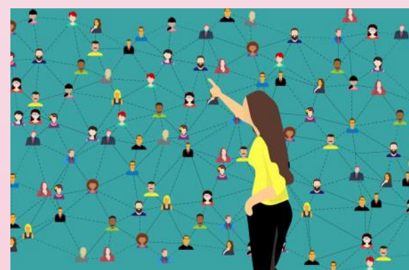
De gebiedsmakelaar wijst de weg in het gemeentelijk doolhof.

"Dat soort kwesties kun je beter doorgeven via de MijnGemeente-app. Dit kan ik zelf niet oplossen en ik zal je dan ook doorverwijzen naar de app. Maar je kunt ook het Klant Contact Centrum van de gemeente bellen: 0485-854000."