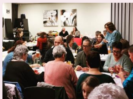
Kienen in de Nielt