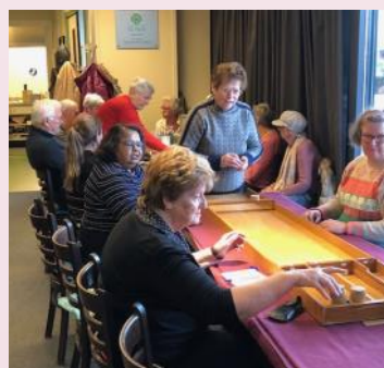
Sjoelen in De Nielt.