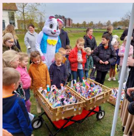
Paasactiviteit in de Cuijkse Tuinen