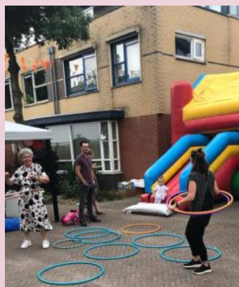
Buurtfeest in de Brem