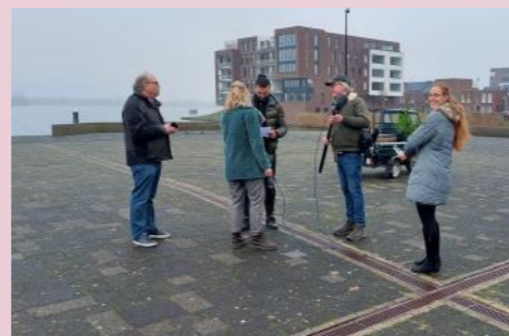
Filmopnamen voor de 'Avond van de Schatbewaarders'.

De wijkraad is een belangrijke gesprekspartner voor de bestuurders van het Land van Cuijk. Zeker voor de hierboven genoemde thema's is dat van belang. Via de nieuwsbrief en onze website houden we alle wijkbewoners op de hoogte van de vorderingen van deze werkgroepen. Via Instagram en Facebook attenderen we u op nieuws en actuele activiteiten en delen we mooie plekken en leuke momenten in onze wijk. Ook dit jaar zullen we weer met onverminderd enthousiasme onze medebewoners aansporen om met ons mee te doen!