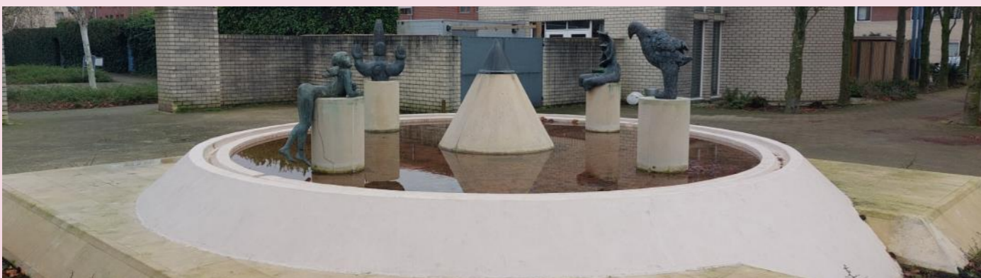
De fontein in de Hof van Heden ligt er weer prachtig bij.