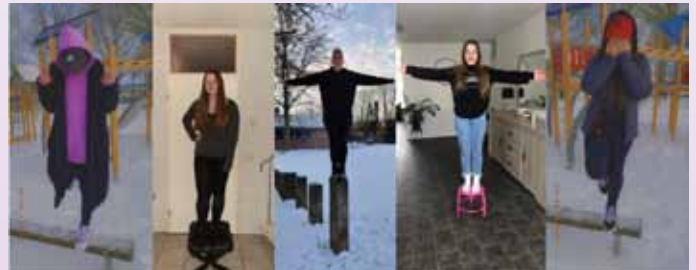
Foto: Leerlingen en hun docent oefenen alvast voor de challenge

Elk jaar zetten de 4de-jaars DPZ (zorg en welzijn) leerlingen van het Merletcollege in Cuijk zich in voor een goed doel. Het goede doel kiezen ze zelf. Dit jaar is dat Stichting Mind. De leerlingen hebben hiervoor gekozen omdat iedereen direct of indirect te maken heeft of krijgt met psychische problemen. Juist in deze tijd is het belangrijker dan ooit dat er aandacht komt voor de mentale gezondheid en dat het taboe, wat nog steeds heerst, doorbroken wordt.